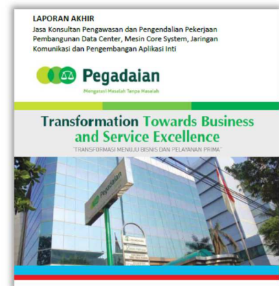
Core System, DC & WAN Assessment